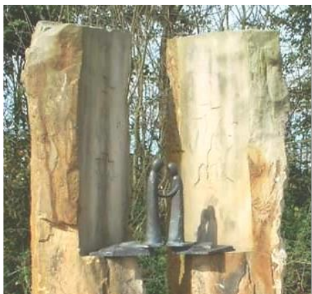
Bildausschnitt der 7. Station des Glaubensweges.

Zwei dicht nebeneinander stehende Steinblöcke versinnbildern, da sie einander nicht berühren, einen tiefen Spalt, der Krieg und Feindschaft ausdrücken soll. Die abgeschrägten Innenflächen im jeweils oberen Bereich, die einander gegenüberliegen, zeigen reliefartig in Stein gehauene Szenen aus dem Zweiten Weltkrieg: